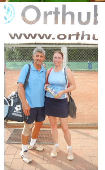
So strahlend ist das Damen- und das Mixed-Doppel.